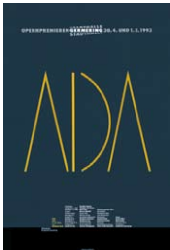
Oper Stadthalle Germering 1993