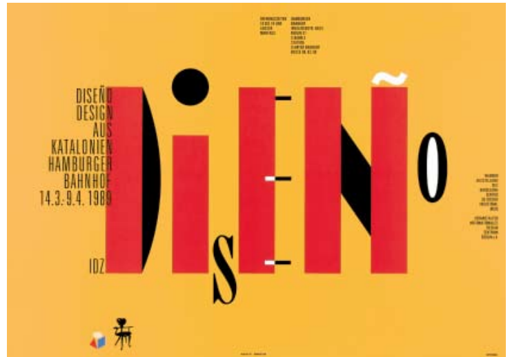
Ausstellung IDZ Berlin 1989