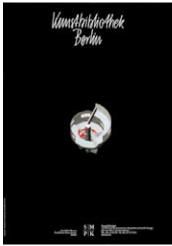
Kunstbibliothek Berlin SMPK 1984 Plakatserie