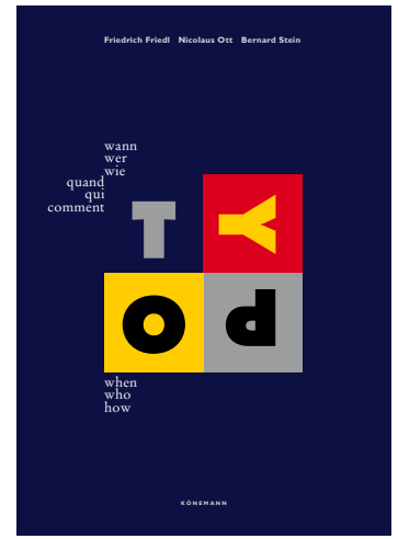
Buch Könemann 1998

Die optischen Sensationen darin sind die unerwarteten, scheinbar einfachen und sachlichen Visualisierungen von Information. Text- und Bildmitteilungen sind klar gegliedert und folgen ausgewogenen Formgerüsten sichtbarer und hinterlegter Flächengeometrien. Ott+Stein haben das Plakat wieder in die Fläche geholt. Mit zeichenhaft lakonischen und typografischen Kompositionen, in denen Konstruktion und Dekonstruktion ausbalanciert sind, haben sie signifikante Sprachbilder geschaffen. Stiller Ernst verbindet sich darin mit hintergründigem Humor, sachliche Strenge mit spielerischer Leichtigkeit. Farbe ist Raum und Fläche zugleich. Seit den achtziger Jahren begannen sie, sich verstärkt mit Typografiegeschichte auseinanderzusetzen. 1988 hatten sie ihren ersten Lehrauftrag an der HdK in Berlin. Von 1994 bis 1998 arbeiteten sie gemeinsam mit Friedrich Friedl an dem Kompendium zur Typografiegeschichte »Typo – wann wer wie«. Seit 1998 unterrichten Nicolaus Ott und Bernard Stein an der Kunsthochschule Kassel, wo sie sich den Lehrstuhl für Visuelle Kommunikation teilen. Ott+Stein sind Mitglied der AGI Alliance Graphique Internationale seit 1987.