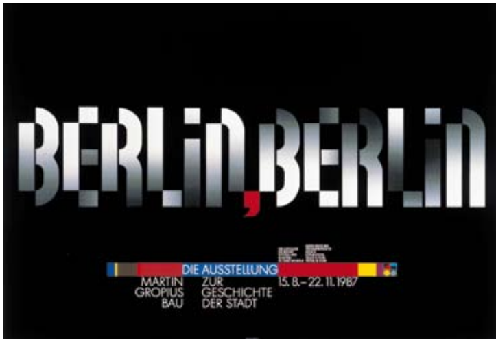
Ausstellung Berliner Festspiel GmbH 1987