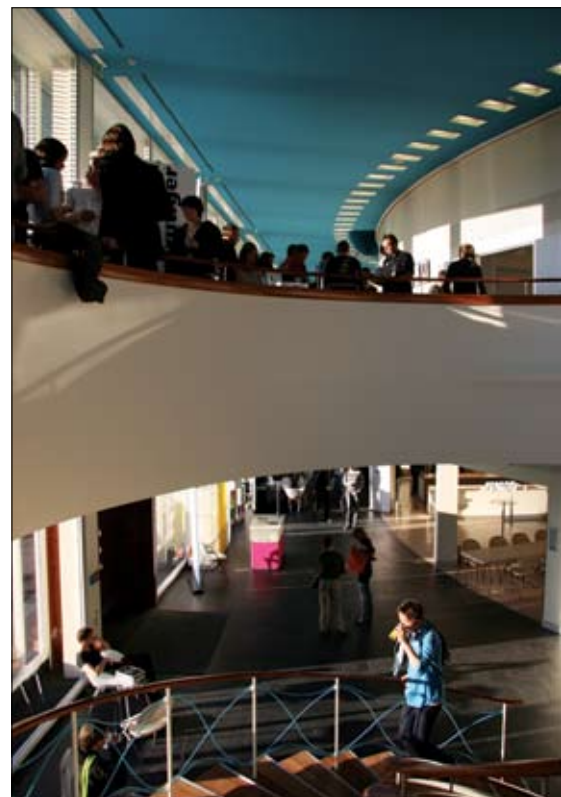
Stojnica LinoType v nadstropju, odmor za kavo v pritličju