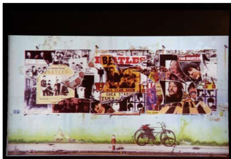
Voormannova oblika za kompilacijo del Beatlov v začetku devetdesetih let