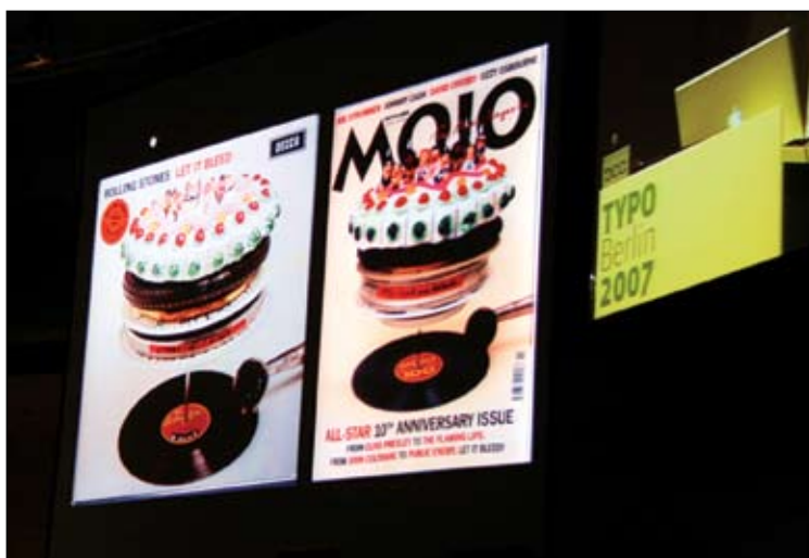
Vpliv ovitka na obliko naslovnice

Ekipa Fontshopa je sicer že nekoliko rutinirano in brez zapletov izvedla eno vodilnih svetovnih oblikovalskih konferenc, a je bilo tudi tokrat tako, da je Typo Berlin znova postregel z veliko raznovrstnostjo in presežki znotraj teme.