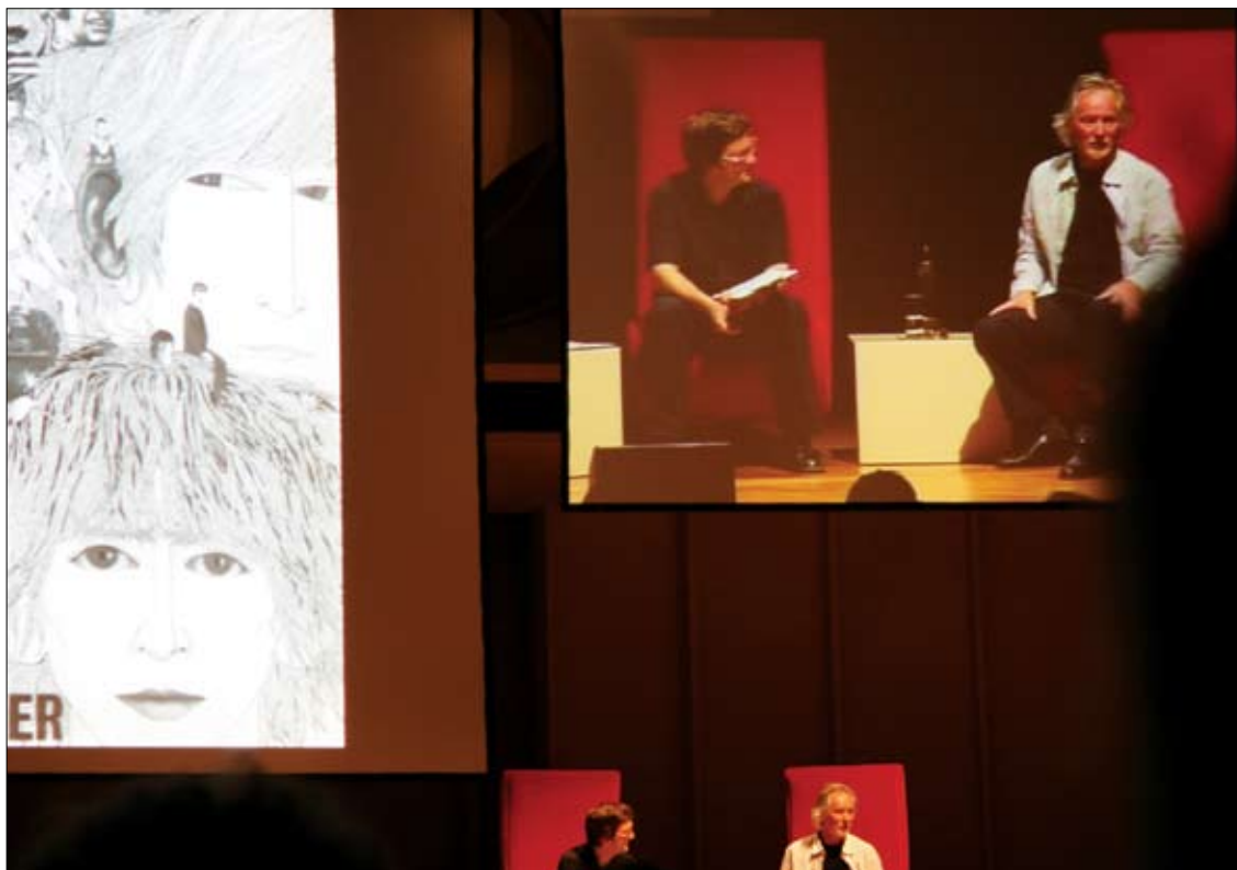
Klaus Voormann o ovitku Revolver

medijem. Na svetu obstajajo filmi o najbolj nenavadnih živalih, napravah, dogodkih. Nikjer pa nisem zasledil filma o tipografiji, ki je tako zelo vseprisotna in samoumevna. Preprosto: rad imam fonte in grafično oblikovanje, zato sem si želel videti film o tem. Pa sem ga naredil". Helvetica je poklon tipografiji, ki letos praznuje 50-letnico obstoja, je film s preprostim konceptom in z izjemno sporočilnostjo. Slavni tipografi, kritiki in grafični oblikovalci (Vignelli, Brody, Spiekermann, Carter, Zapf, Carson, Crouwel, Sagmeister, Poyner ...) Helveticu in grafično oblikovanje razložijo z različnimi pogledi in stališči, Hustwit pa jih mojstrsko sestavi v poučno 80-minutno potovanje okrog sveta. Tipografija je pisana oblika jezika, pravi Ellen Lupton . Odlični film navdušujoče razlaga to čarobno povezavo.