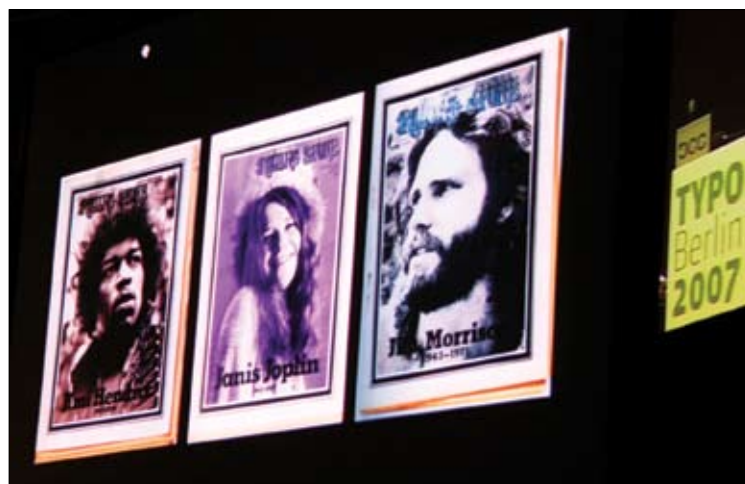
Glasbeni bogovi na naslovnica revije Rolling Stone (iz zbirke H. Moserja)