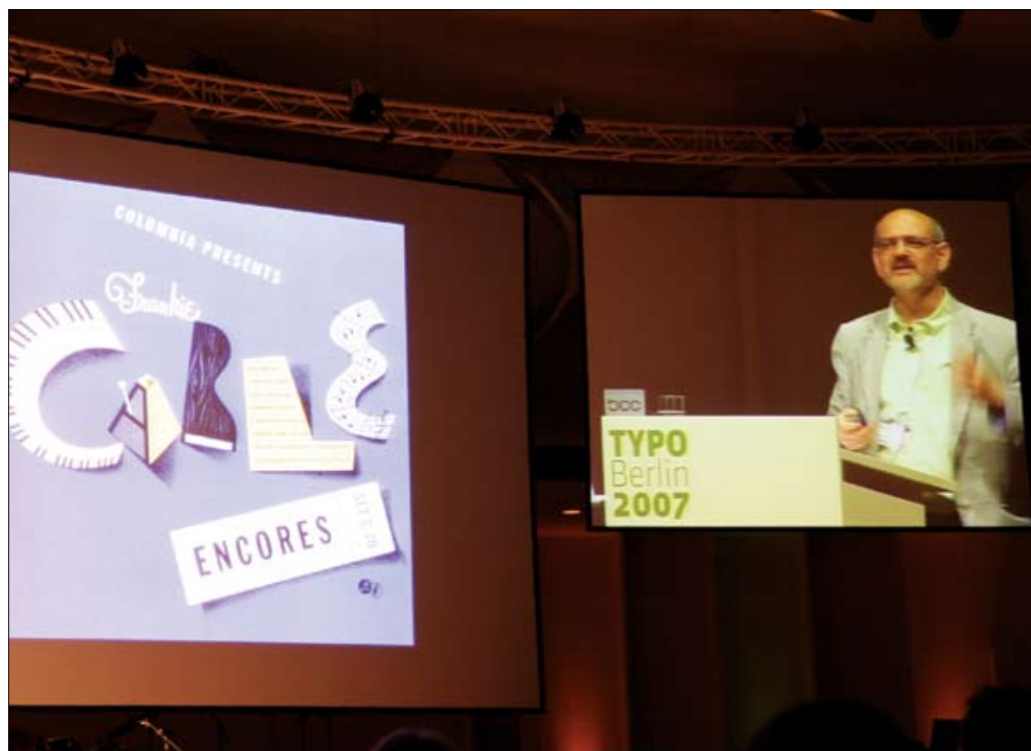
Steven Heller o začetniku LP-ovitkov Alexu Steinweissu