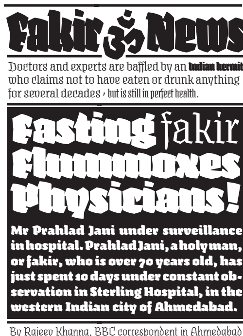
»Is Not Take Away« – Magazin für Schriftliebhaber mit dem neuen Underware-Font »Fakir«